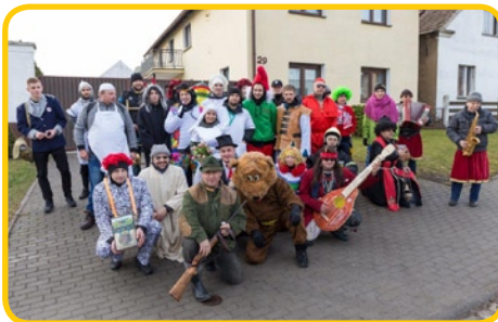
... Żlinicach (źródło: www.boguszyce.pl )