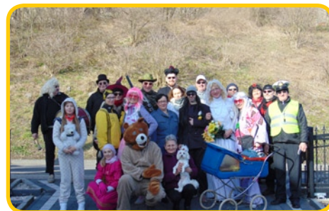
... Zimnicach Małych