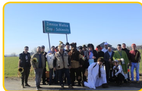
... Zimnicach Wielkich