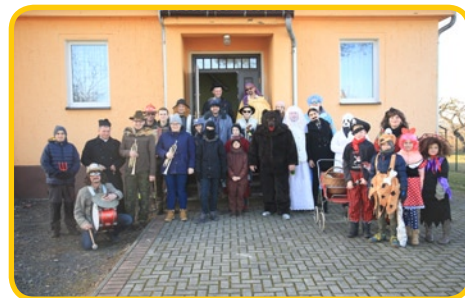
... w Nowej Kuźni

Wszystkim inicjatorom oraz uczestnikom Wodzenia Niedźwiedzia serdecznie dziękujemy i do zobaczenia za rok!